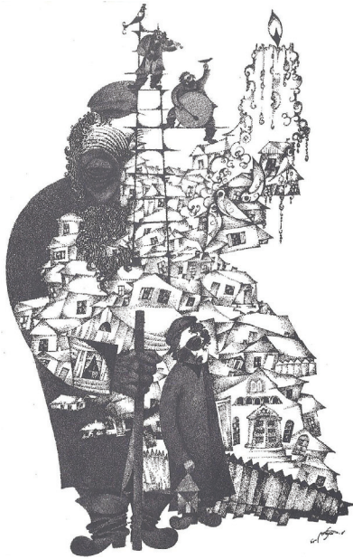
תמונה 6: משה ברנשטיין, זקן וילד בעיירה, 1965.

עמי נשחט! מאותו יום בא שינוי במהלך מחשבותי ותוכן חיי, ואת המשך דרכי כאמן הקדשתי ומקדיש לנושא העיירה. מלווים אותי בדרך זו מיליוני עיניים, עיני יהודים שמשתקפת בהם עמקות העצב המיוחד... 18 ביצירותיו של ברנשטיין אנו מוצאים ביטוי אקספרסיבי וסנטימנטלי לתרבות היהודית שנכחדה. למשל, ביצירה "זקן וילד בעיירה" מ-1965 (תמונה 6) הוא מתאר יהודי זקן עם כובע, זקן ומקל נדודים, ולידו ילד עם קפוטה ופאות, האוחז פנס־נר. ביצירה זו משולבים בתי העיירה היהודית, שובכים עם יונים, בית כנסת, גדרות וכליזמרים על סולם. בקצה העליון בצד ימין, מתוך המארג הזה, מזדקר נר עם להבה, המשמש כנר זיכרון לעיירה היהודית וכתזכורת מתמדת לחורבן העולם היהודי באירופה בזמן השואה.