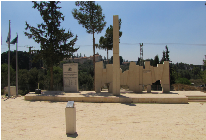
תמונה 8: אלכסנדר בוגן, לזכר הפרטיזן, הלוחם והמורד היהודי, 2008.

לפיד הזיכרון. לצד הבמה ניצבים שלושה תרנים, ועליהם מתנוססים שלושה דגלים: בימין דגל חיל השריון, במרכז דגל מדינת ישראל ובשמאל דגל ארגון הפרטיזנים לוחמי המחתרת והגטאות. אנדרטה זו מעלה על נס את גבורת הפרטיזנים ולוחמי המחתרות והגטאות, כמייצגת דפוס התנהגות אקטיבית-לוחמת בתקופת השואה. עצם הצבת האנדרטה במתחם הנצחה של חיל השריון, תרומת משפחת הקצין לניר, ובצדה שלושת הדגלים, מבטאת רצף היסטורי של לחימה, ובכך מציגה את המונצחים באנדרטה כמי שמסרו נפשם למען העם והמולדת. שתי האנדרטות שנדונו כאן מייצגות את המגמה העיקרית של "שואה וגבורה", שהתגבשה בתודעה ובהוויה הציבורית בישראל באשר להנצחת השואה.