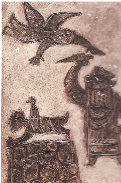
תמונה 5: פנחס שער, עקידת יצחק, שנות השישים.

זו מציג האמן את עצמו כקורבן. הבחירה של שער בנושא עקדת יצחק וחסרונו של האיל – המייצג את הקורבן, שהוא בעצם האמן עצמו – מראים שהאמן עסק בשואה באופן סמוי, וכן מרמזים על השאלה, מדוע לא בא האלוהים לעזרת עמו?