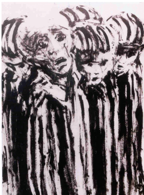
תמונה 2: יצחק בלפר, מוזלמנים בבגדי אסירים, שנות השישים.

”הקרמטוריום באושוויץ” בשנת 1949 (תמונה 3). 10 נראה כי האמן מייזג ביצירה זו בין תאי הגזים לבין המשרפה. הוא מתאר באופן גרוטסקי ערמה של דמויות ערומות של נשים, דחוסות זו על גבי רעותה. כמה מהן נראות נאבקות זו בזו כדי להיחלץ מהגורל המר. זהו תיאור קשה של הדרך האכזרית שבה מצאו קורבנות השואה את מותם.