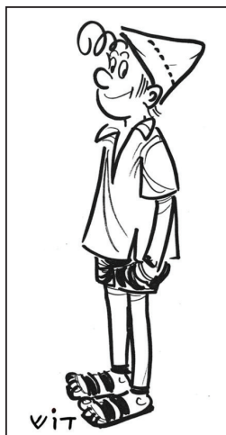
תמונה 12: קריאל גרדוש (דוש), שרוליק, 1952.

קיצור שם משפחתו גרדוש. תחילת דרכו כקריקטוריסט הייתה בביטאון הלח"י, בדבר השבוע, באשמורת ובשבועון העולם הזה. ב-1953 הצטרף למערכת עיתון מעריב, ובמשך יותר מחמישים שנה, עד מותו בשנת 2000, פרסם בעיתון הזה קריקטורה פוליטית יומית. בד בבד עסק גם בכתיבת מאמרים, סיפורים ומערכונים. ב-1952